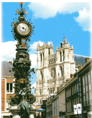
L'horloge Dewailly et la Cathédrale Notre Dame

Nous avons découvert les hortillonnages au fil de l'eau, en toute sécurité à bord de barques électriques à fond plat et dans un grand silence : juste le chant des oiseaux ! Nous avons admiré tous ces jardins maraîchers flottants ainsi que ces parcelles magnifiquement fleuries, aux multiples couleurs, dans un écrin de verdure en pleine ville. Puis nous avons fait le tour de la ville sur les traces de Jules Verne, avec une halte au cimetière de la Madeleine où il repose. Ensuite après un excellent repas typiquement Picard, nous avons terminé par la magnifique cathédrale Notre Dame et sa remarquable architecture. Vers 17h, c'est le retour, bien fatigués mais ravis d'avoir découvert la ville d'Amiens et ses hortillonnages qui en font une ville à la campagne.